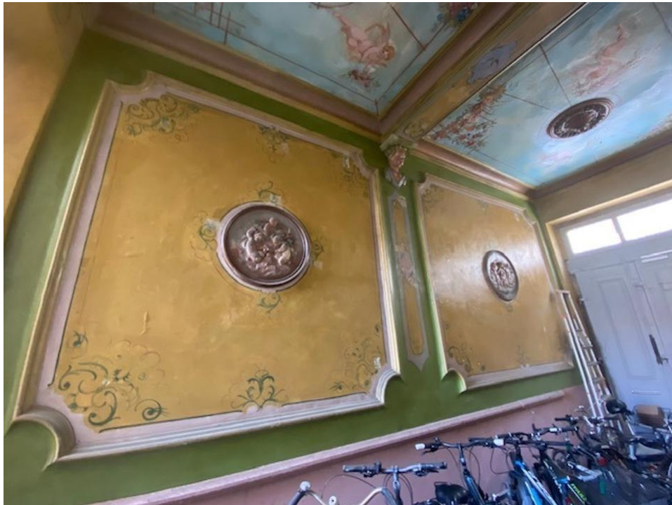
Durchgang zum Haus