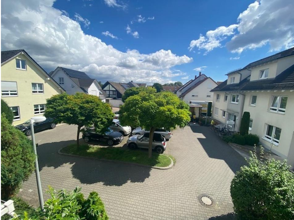
Blick zur Straße